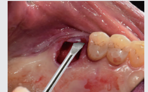
SURGICAL CURETTES 사용