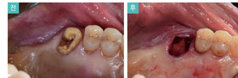
EASY TOOL 사용 발치 전, 발치 후 치조골의 데미지를 최소화하여 잔존 치질과 치조골의 손상없이 발치가 된 것을 볼 수 있다.