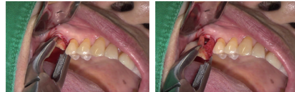
EASY FORCEP 사용 FORCEP1, FORCEP2

팁의 특화된 디자인으로 기존의 치아를 잡고 발치하는 방식이 아닌 치주 안쪽을 파고들어 발치하는 새로운 접근방식으로 렉세이션 효과와 잔존 루트가 남아있을 가능성이 적고, 치조골의 데미지를 최소화 할 수 있습니다.